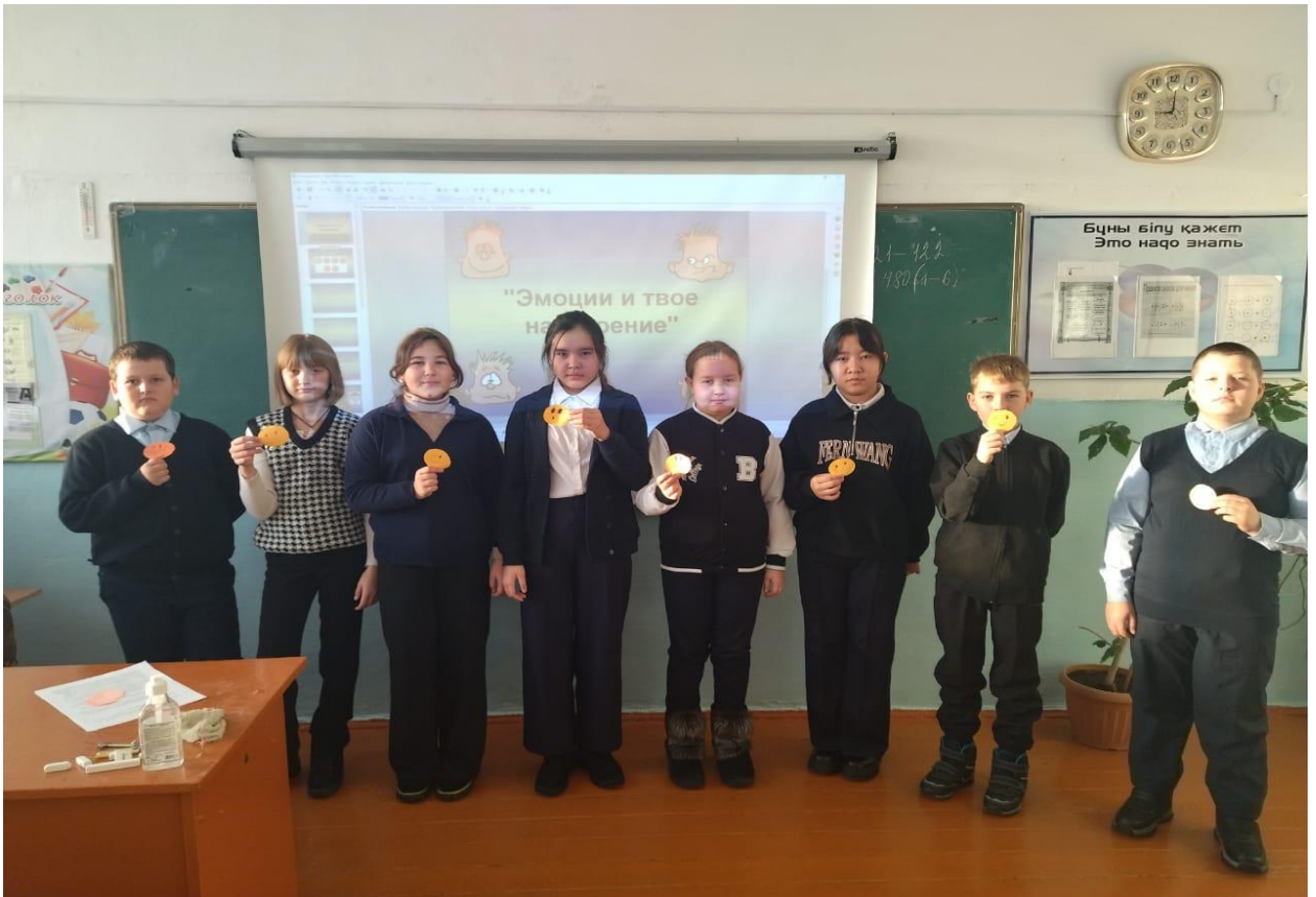
Презентация в 5 классе “Эмоции и твоё настроение”