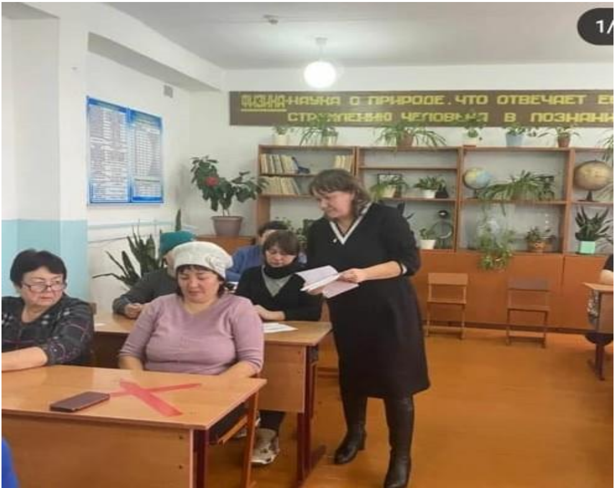
«Домашние задания. Как помочь ребенку хорошо учиться» Родительское собрания.